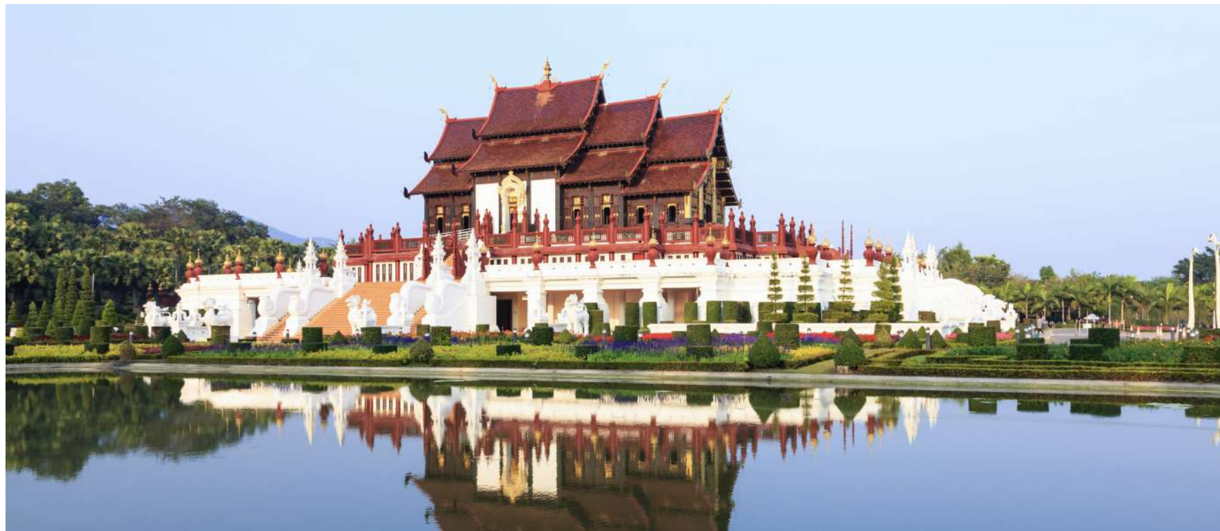
PABELLÓN REAL EN ROYAL FLORA PARK