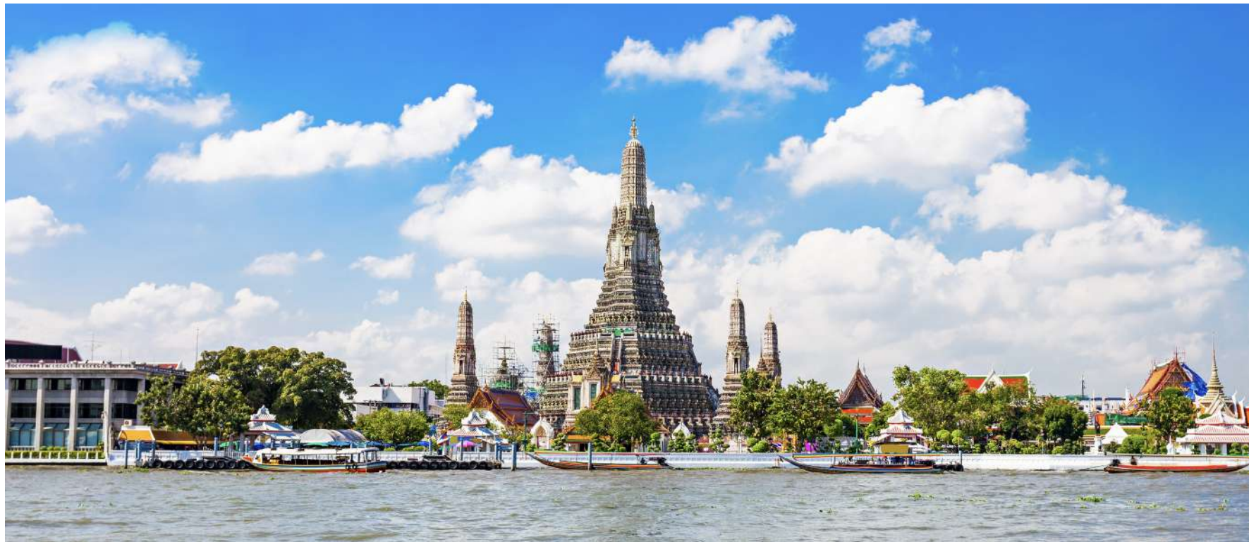
TEMPLO WAT ARUN