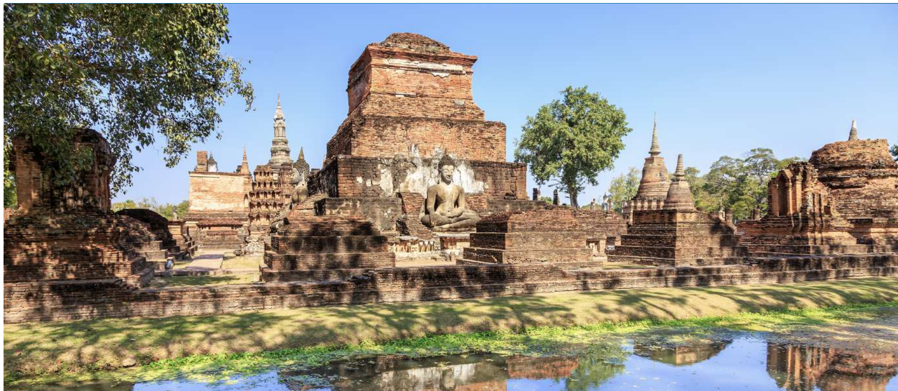
CIUDAD EN RUINAS “AYUTTHAYA”